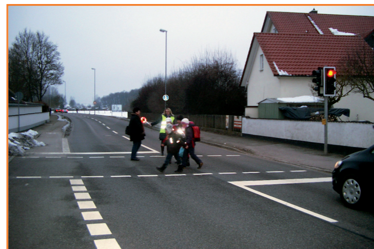
Fußgängerampel in der Kipfenberger Straße