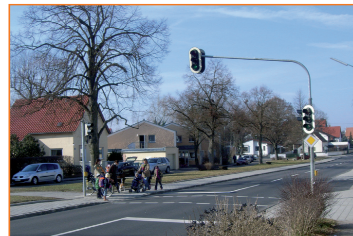
Fußgängerampel in der St.-Michael- Straße